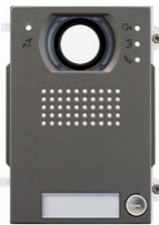
41271 - Mod. front. teleloop A/V 1P IK10IP54 Heavy