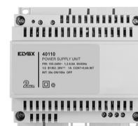
40110 - Alimentatore 2F+ 100-240V 1 OUT 1,6A