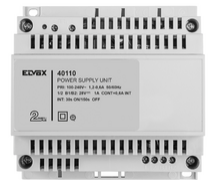
40110 - Alimentatore 2F+ 100-240V 1 OUT 1,6A