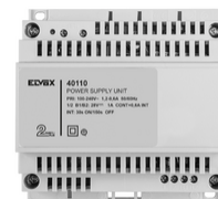
40110 - Alimentatore 2F+ 100-240V 1 OUT 1,6A