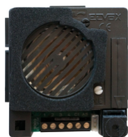
930G - Unità Sound System audio per 4+n