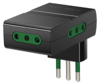
RI.00310 - Adattatore mult. S11 + 3P11 nero