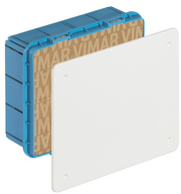
V70006 - Scatola derivazione incasso 195x154x70mm