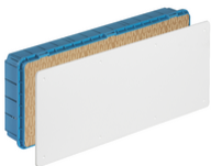
V70010 - Scatola derivazione incasso 515x201x80mm