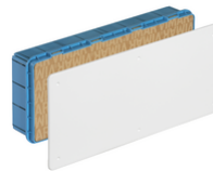
V70008 - Scatola derivazione incasso 391x154x70mm