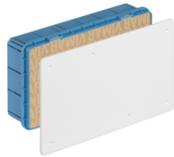
V70007 - Scatola derivazione incasso 287x154x70mm