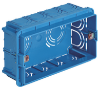
V71304 - Scatola incasso rettang. 4M azzurro