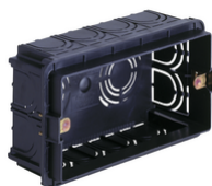
V71304.AU - Scatola incasso rettang.autoest. 4M nero