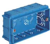
V71304 - Scatola incasso rettang. 4M azzurro