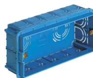
V71305 - Scatola incasso rettang. 5M azzurro