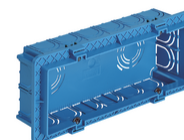
V71306 - Scatola incasso rettang. 6-7M azzurro