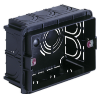
V71303.AU - Scatola incasso rettang.autoest. 3M nero