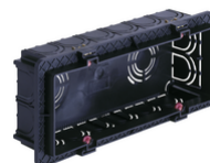
V71306.AU - Scatola incasso rettang. 6-7M nero