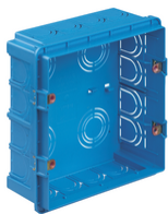
V71318 - Scatola incasso rettangolare 8M azzurro